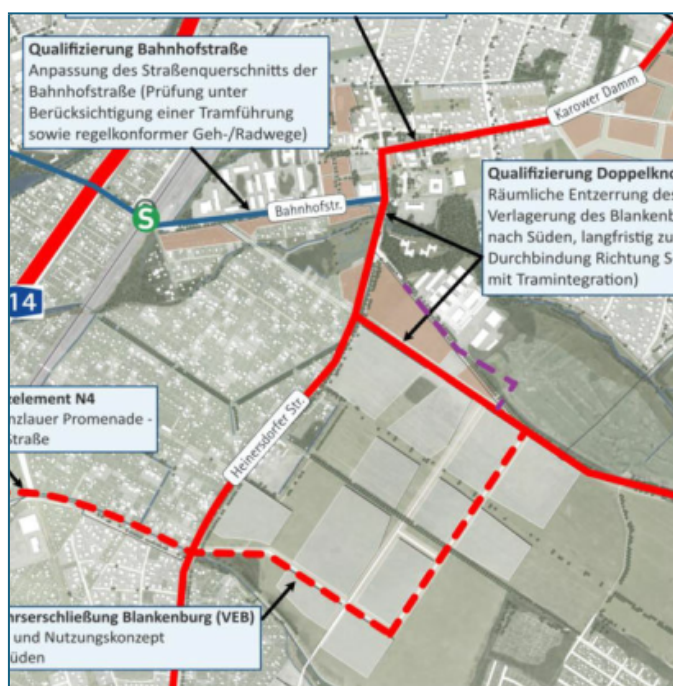
Abbildung 1: Rahmenplan Blankenburg [4]

Für die ausreichende Erschließung des Blankenburger Südens ist weiterhin der Anschluss der Tram zum S-Bahnhof Blankenburg sinnvoll – und daher ist es notwendig, den Beschluss VIII-1095, auch nach mehrfach geänderter Planung des Senats, erneut zu bekräftigen. Die Verlängerung der Tram zum S-Bahnhof Blankenburg läuft der aktuellen städtebaulichen Planung [6] nicht zuwider, sondern verbessert mit einer direkten Anbindung das Potenzial zur Schaffung des dringend benötigten, bezahlbaren Wohnraums in Pankow.