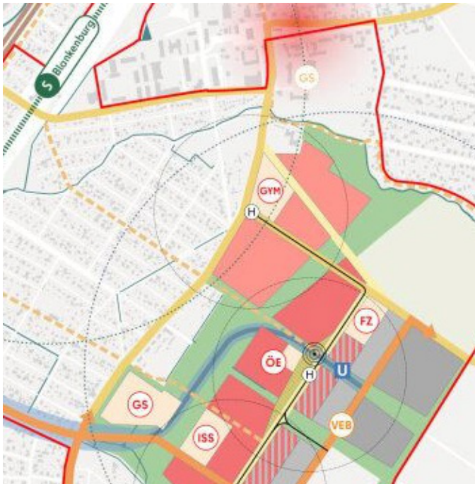
Abbildung 2: Struktur - und Nutzungskonzept [5]

[1] https://bv-pankow.berlin.de/pi-r/vo020_r.asp?VOLFDNR=5443